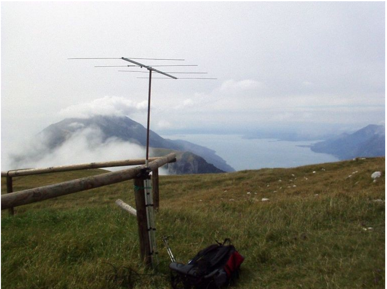
antenna in vetta sempre con lago di garda