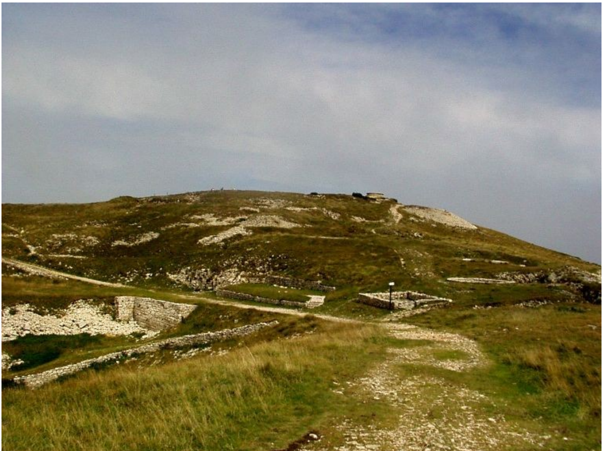
postazioni militari 1915/1918 in vetta