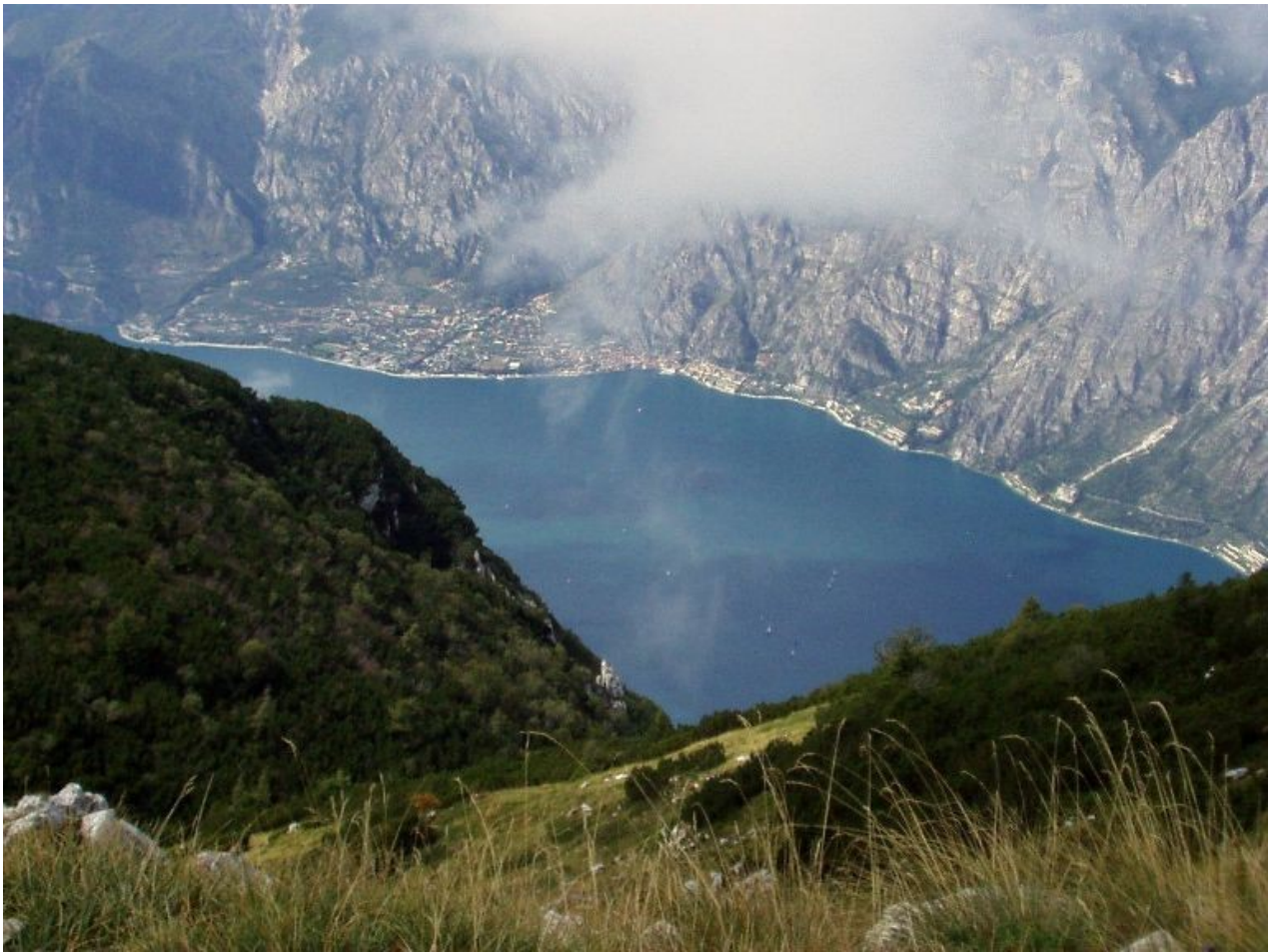
lago di garda