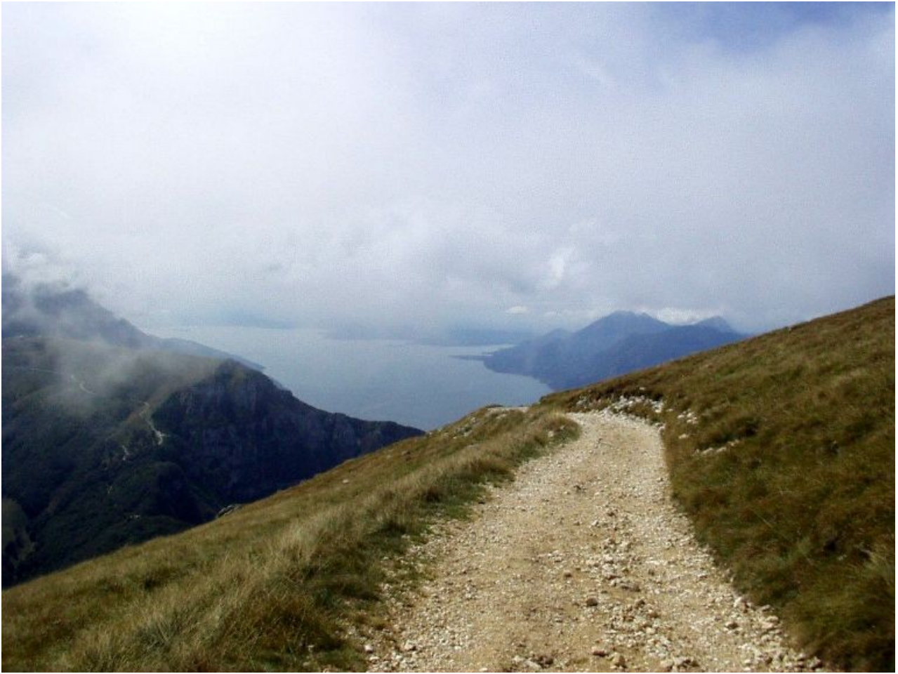
percorso salendo con vista sul lago di garda