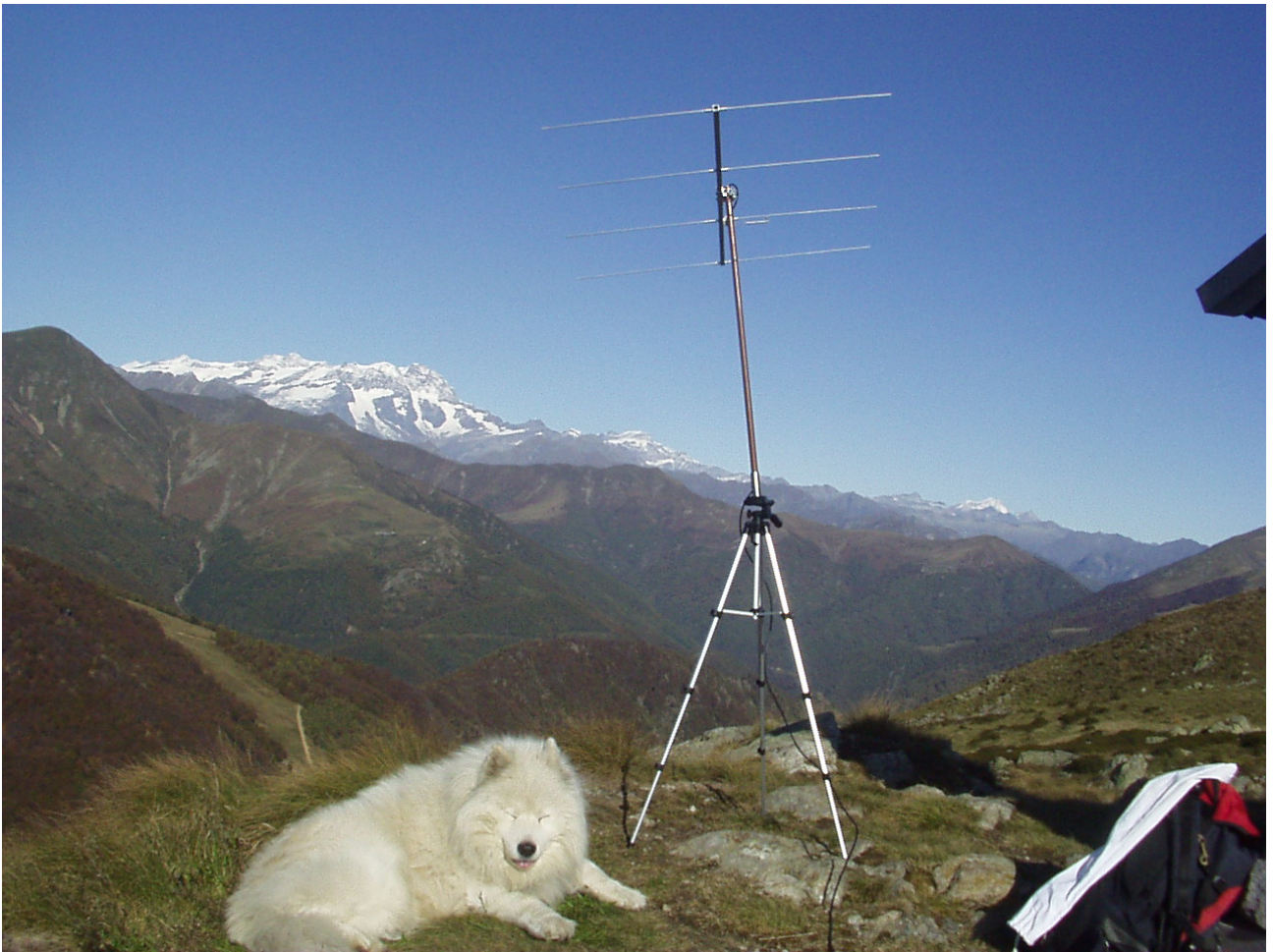
antenna e secondo operatore