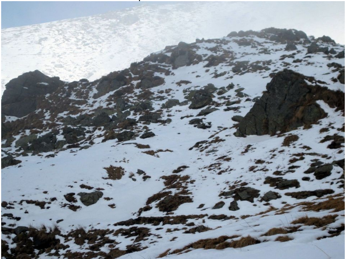
panorama a monte