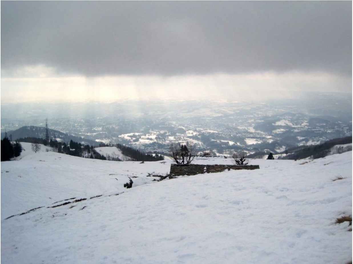
panorama a valle